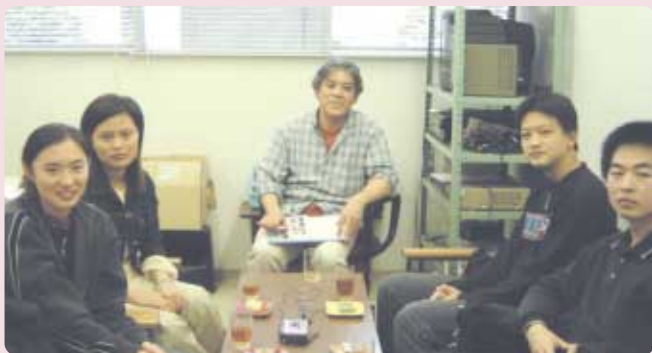
( 5 月 26 日 大学図書館にて インタビュアー：図書館 上原 )

— お疲れのところありがとうございました。みなさんの学校と実践女子大学図書館のサービスの違いやインフラの進んでいる中国のインターネット環境など、有意義な話がたくさん聞けました。みなさん日本はこれから梅雨の季節になります。体調に気をつけ、実践 (日本) で多くの事を学んでいてください。